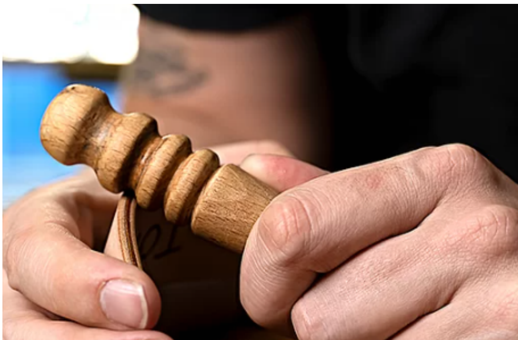
Krawędzie przed i po użyciu Tokonole.